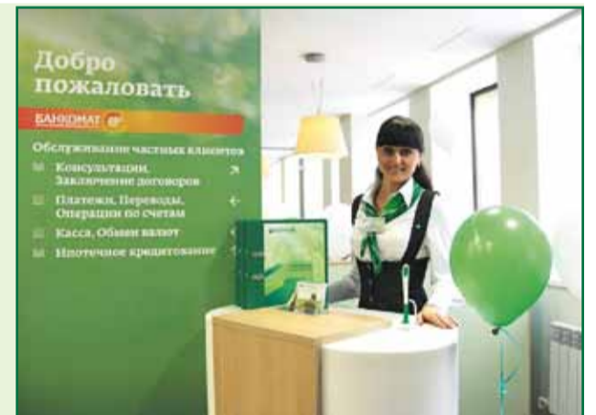
В допосе нового формата Белгородского отделения

Кроме перечисленных выше форматов, в 2011 году в Центрально-Черноземном банке были использованы еще два – флагманское подразделение и офис самообслуживания. Флагманское подразделение было открыто в Тамбове (см. материал выше). Этот формат подразумевает крупное расширенное подразделение с особым дизайном, расположенное на центральной магистрали города. Такие подразделения призваны продемонстрировать новое «лицо» и новые стандарты качества обслуживания кли-