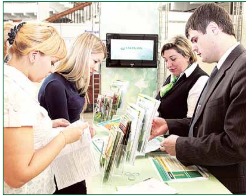
Сотрудники ЦЧБ Сбербанка России консультируют участников Форума

Между тем, как неоднократно подчеркивал председатель Центрально-Черноземного банка Сбербанка России Александр Соловьев, высокую значимость для экономического развития Черноземья имеют два направления – агропромышленный комплекс и малый бизнес. С мнением руководителя крупнейшего банка региона согласны многие эксперты и представители власти. Поэтому вполне возможно, что в скором будущем эффективное использование этих инструментов позволит высокими темпами развивать реальный сектор экономики областей ЦЧР. Во всяком случае, количество положительных примеров в этом направлении растет из года в год.