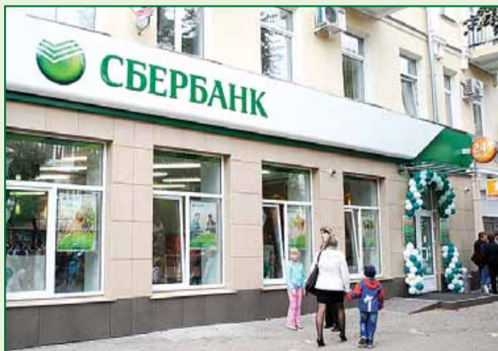
Допосе №058 в Воронеже

устройств самообслуживания и отсутствуют постоянные рабочие места сотрудников банка. Такое подразделение было открыто в Белгороде.