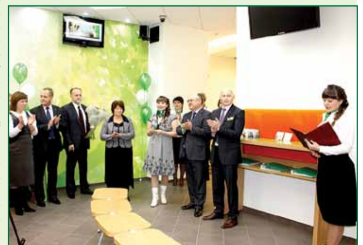
г. Курск. Открытие филиала нового формата

Вторым по количеству введенных офисов ока-