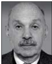
Геннадий ЧУФРИН, член дирекции ИМЭМО РАН, член-корреспондент РАН

Сближаясь с Китаем, мы могли бы решить многие проблемы, в их числе — привлечение инвестиций, изменение структуры экспорта и развитие Дальнего Востока, — считает Геннадий Чуфрин, член дирекции ИМЭМО РАН, член-корреспондент РАН.